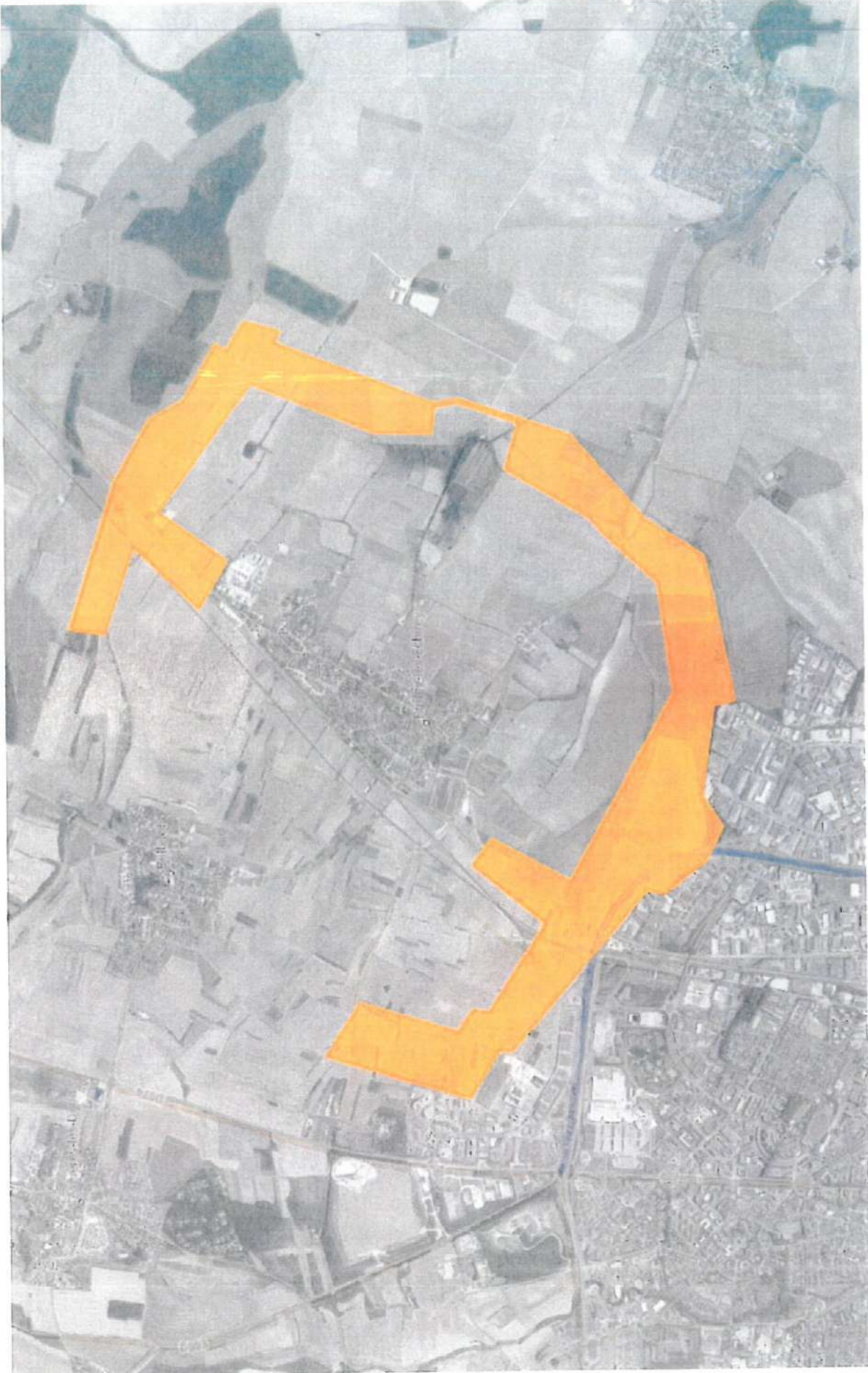
ANNEXE 1 : Eolien de moyenne taille, ou axe verticale